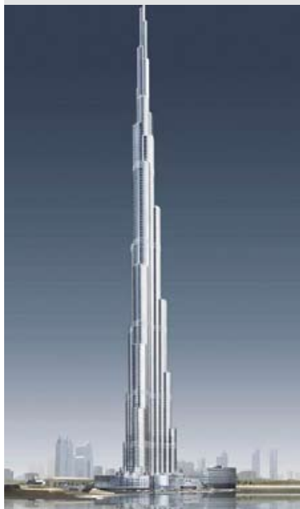
Boven: Armani Hotel